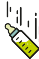
Aufheben von Gegenständen