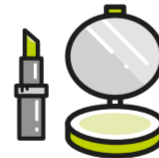
Schminken und Körperpflege