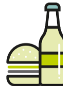
Essen und Trinken